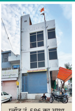
प्लॉट नं. 586 का आधा भाग जिसे निगम ने अवैध कॉमर्शियल निर्माण व जीरो सेटबैक पर सीज़र किया।

जयपुर (हिलव्यू समाचार)। प्लॉट 586 बीस दुकान के कॉर्नर के आधे अवैध निर्माण को सीज़र किया और आधे बहुमंजिला निर्माण, जीरो सेटबैक और बड़े बड़े बेसमेंट को नज़रअंदाज़ कर दिया? इसी के सामने दुकान नंबर 5-6 पर भी छत पर अवैध निर्माण चल रहा है जबकि बीस दुकान की दुकानों की छत पर निर्माण कार्य या आवास नहीं बनाया जा सकता है। आदर्शनगर जोन नगर निगम हैरीटेज लगातार शानदार कार्यवाही कर रहा है लेकिन इसी के साथ