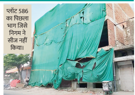
प्लॉट 586 का पिछला भाग जिसे निगम ने सीज़र नहीं किया।

इसकी दोहरी नीति आम जनता में आदर्शनगर जोन के अधिकारियों व कमचारियों को कटघरे में खड़ा कर रही है क्योंकि एक ही प्लॉट पर होते