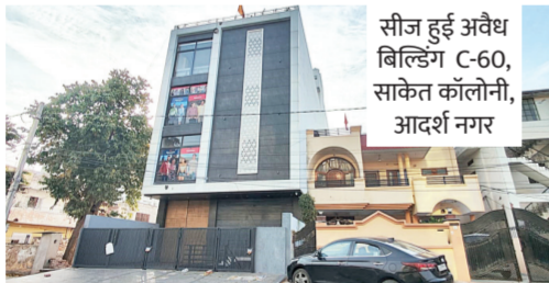
सीज़र हुई अवैध बिल्डिंग C-60, साकेत कॉलोनी, आदर्श नगर