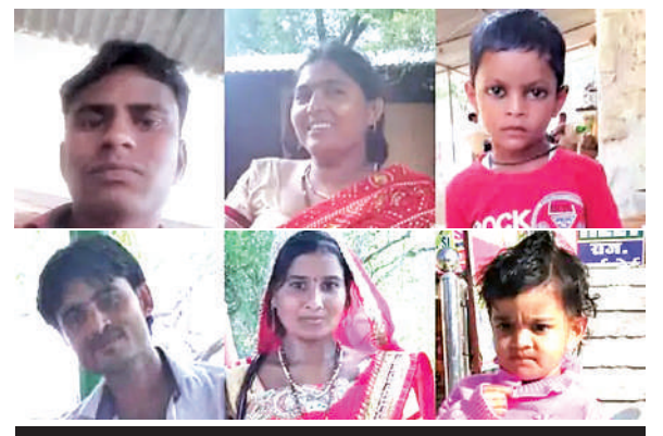
हादसे में इनकी गई जान

दर्शन कर लौटते समय हुआ हादसा: जानकारी के अनुसार परिवार खाटू श्याम जी के दर्शन के लिए कार से गया था। वहां से लौटते समय हादसे का शिकार हो गया। हादसे में एक ही परिवार के दो बच्चों समेत छह लोगों की दर्दनाक मौत हो गई। उनकी कार जैसे ही रूपावास के पास पहुंची तभी सामने से आ रही बस से जोरदार टक्कर हो गई। बताया जा रहा है कि चालक को झपकी आने की वजह से ये हादसा हुआ। हादसे के बाद धमाके की आवाज सुनकर ग्रामीण मौके पर पहुंचे और पुलिस को सूचना दी। कार की हालत देखकर हादसे की भयावहता का अंदाजा लगाया जा सकता है। कार पूरी तरह से पिचक गई थी।