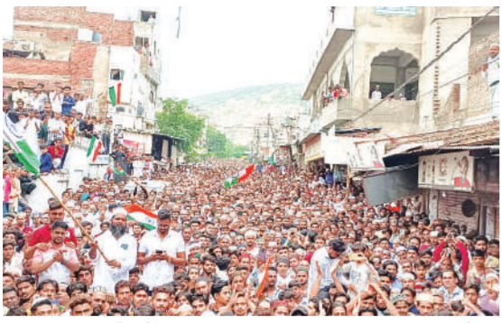
भट्टा बस्ती में मुस्लिम समाज का प्रदर्शन