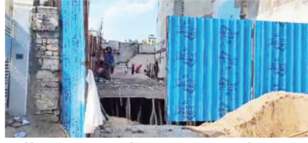
प्लॉट न.475 गली न.05, राजापार्क