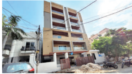
प्लॉट न.527, गली न.05, राजापार्क