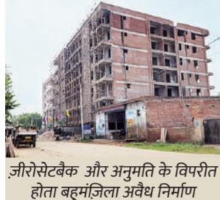
जीरोसेटबैक और अनुमति के विपरीत होता बहुमंजिला अवैध निर्माण