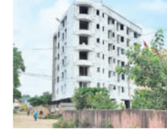
बिल्डिंग बायलॉज के नियमों की अवहेलना के साथ-साथ सड़क पर अतिक्रमण