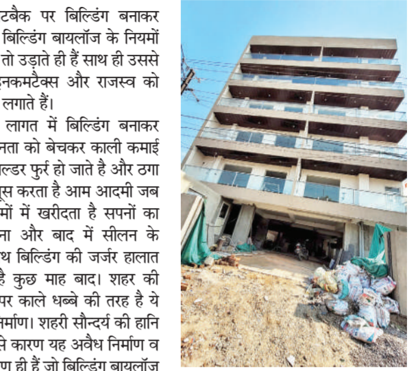
प्लॉट न.529, गली न.05, राजापार्क