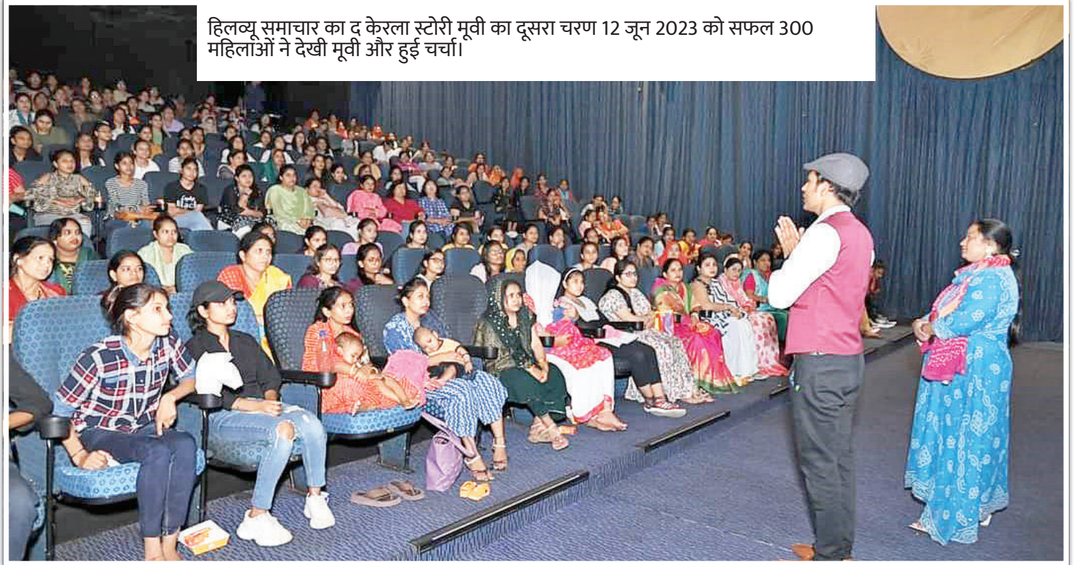
हिलव्यू समाचार का द केरला स्टोरी मूवी का दूसरा चरण 12 जून 2023 को सफल 300 महिलाओं ने देखी मूवी और हुई चर्चा।