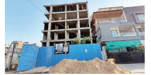
270/4 राजापाक, जवाहर नगर थाने के सामने बायीं ओर होता निगम की परमिशन के विपरीत अवैध निर्माण। जिस-देह अनुमति का बोर्ड लगा है लेकिन कगज़ों की अनुमति और मौके के निर्माण में बड़ा फर्क आसानी से देखा व समझा जा सकता है।

मालवीय नगर जोन मिलीभगत कर बनावा रहा अवैध बिल्डिंग्स