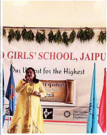
एमजीडी स्कूल, जयपुर में मोटिवेशनल स्पीच देते हुए