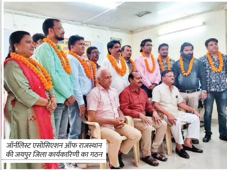
जॉर्नलिस्ट एसोसिएशन ऑफ राजस्थान की जयपुर जिला कार्यकारिणी का गठन