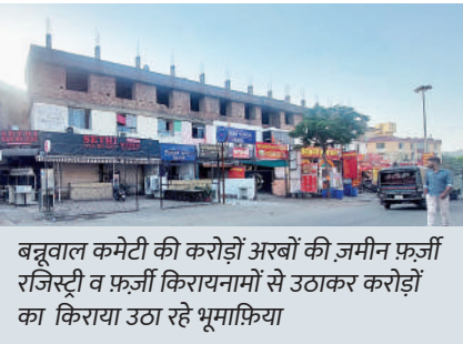
बबूवाल कमेटी की करोड़ों अरबों की जमीन फर्जी रजिस्ट्री व फर्जी किरायनामों से उठाकर करोड़ों का किराया उठा रहे भूमाफिया