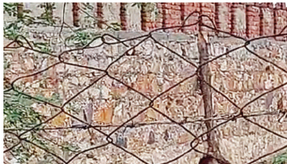
अवैध होटल की अवैध बाउंड्री वॉल में चुन दिए गए हरे-भरे पेड़ गोनेर ग्रास फार्म पर आनन-फानन में किये गए कब्जे के चश्मदीद गवाह हैं।