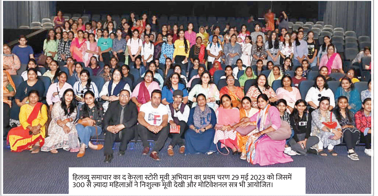
हिलव्यू समाचार का द केरला स्टोरी मूवी अभियान का प्रथम चरण 29 मई 2023 को जिसमें 300 से ज्यादा महिलाओं ने निशुल्क मूवी देखी और मोटिवेशनल सत्र भी आयोजित।