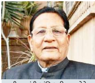
यूडीएच मंत्री शांति धारीवाल गोनेर ग्रास फार्म जंगलात में हुई तबाही के लिए जवाब दें।