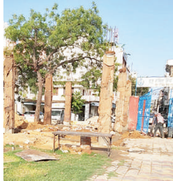
गुरुगोविंद सिंह पार्क गुरुनानकपुरा में विधायक कोटे से ही रहा अवैध निर्माण। सुप्रीम कोर्ट के आदेश की उड़ रही धज्जियाँ!