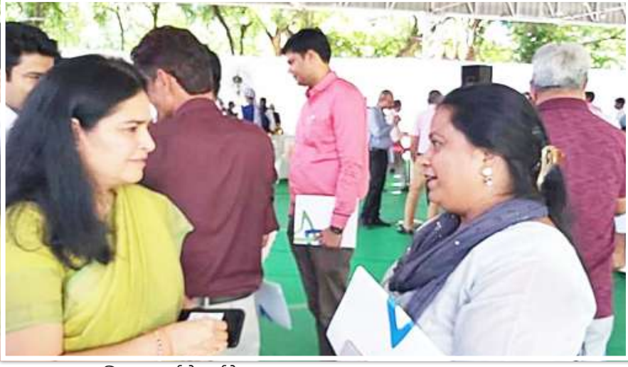
राजस्थान मुख्य सचिव उषा शर्मा से चर्चा के कुछ पल