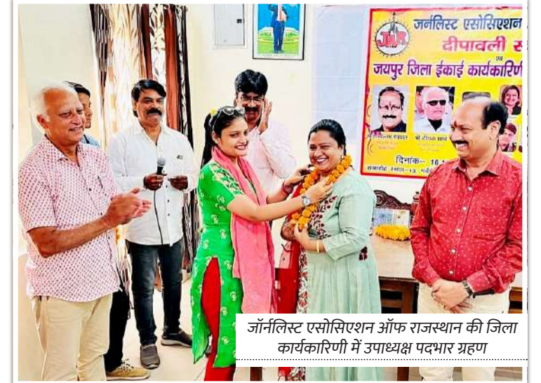
जॉर्नलिस्ट एसोसिएशन ऑफ राजस्थान की जिला कार्यकारिणी में उपाध्यक्ष पदभार ग्रहण