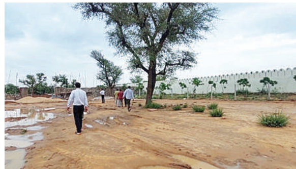
अवैध होटल की अवैध बाउंड्री वॉल और गोनेर ग्रास फार्म पर विजित करती गोनेर इनक्वायरी जेडीए की टीम