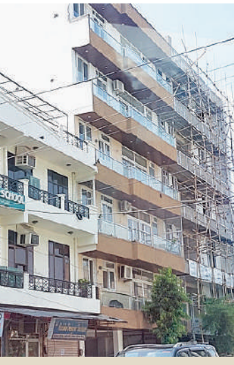
582 A अवैध निर्माण बनकर खड़ा हो गया और अब उससे सटकर 574 का अवैध निर्माण है अंतिम चरण पर। नगर निगम मालवीय नगर जोन सोया है मिलीभगत कर नीड में।