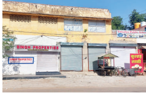
सरकारी स्कूल व पुराने डाकघर पर अतिक्रमण कर बनी अवैध दुकानें जिनकी रजिस्ट्री भी नहीं है फर्जी!