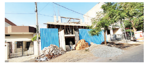
250/4 जवाहरनगर थाने के सामने, राजापाक बिना स्वीकृति और सेटबैक के धड़ल्ले से चलता अवैध निर्माण

नगर निगम से परमिशन कुछ और मौके पर निर्माण कुछ और?