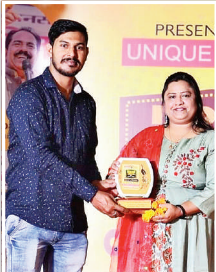
यूनिक जोन किड्स इंडियन बॉलीवुड क्रान्त में चीफ गेस्ट के रूप में शिरकत