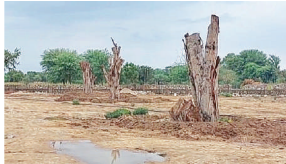
गोनेर ग्रास फार्म की 570 बीघा ज़मीन पर कब्जा करने के लिए काटे गए हरे-भरे पेड़।