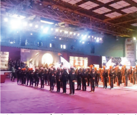
सुरक्षित दृष्टि संभावना और बड़े पैमाने पर समाज के विकास के लिए एसी अन्य शुरुआत करना। अन्य सभी सीपीआर गतिविधियों के साथ, फाउंडेशन व्यक्तिगत सामाजिक उत्तरदायित्व के लिए भी मंच प्रदान करता है।

वित्तीय और डिजिटल साक्षरता इन पहलुओं के अलावा, फाउंडेशन विभिन्न सीएसआर पहलुओं को बढ़ावा देता है जैसे विशेष शिक्षा को बढ़ावा देना, क्विंटस शिविरों के माध्यम से निवारक स्वास्थ्य देखभाल को बढ़ावा देना,