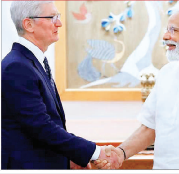
नई दिल्ली, (एजेंसी)। देश की राजधानी दिल्ली में एपल स्टोर के खोलने से एक दिन पहले कंपनी के सीईओ टिम कुक ने प्रधानमंत्री नरेंद्र मोदी से बुधवार को मुलाकात की। टिम कुक ने ट्वीट किया है कि गर्मजोशी से स्वागत के लिए प्रधानमंत्री नरेंद्र मोदी को धन्यवाद। हम भारत के भविष्य पर प्रीधोगिकी के सकारात्मक प्रभाव के आपके दृष्टिकोण को साझा करते हैं - शिक्षा और डेवलपर्स से लेकर विनिर्माण और पर्यावरण तक, हम देश भर में बढ़ने और निवेश करने के लिए प्रतिबद्ध हैं। टिम कुक के ट्वीट को रीट्वीट करते हुए प्रधानमंत्री ने लिखा कि विविध विषयों पर विचारों के आदान-प्रदान और भारत में हो रहे तकनीक-संचालित परिवर्तनों पर चर्चा में अच्छा लगा।