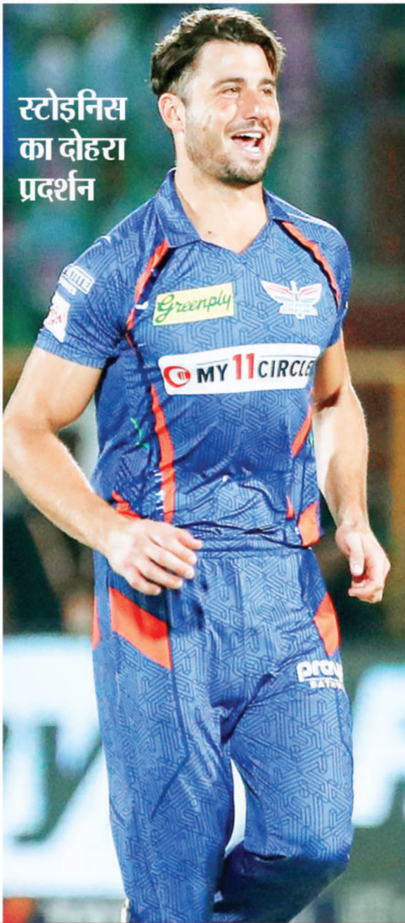
स्टोइनिस् का दोहरा प्रदर्शन