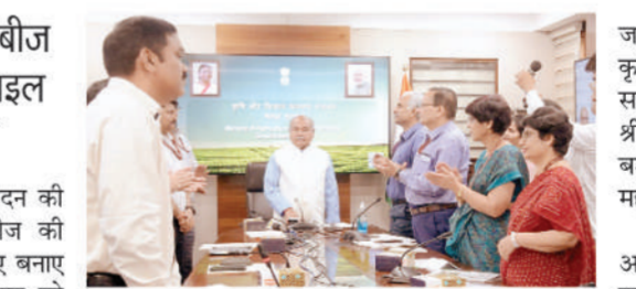
पर श्री तोमर ने कहा कि भारत सरकार कृषि के समक्ष विद्यमान चुनौतियों और कठिनाइयों को निपटाने हेतु हम दुनिया के माध्यम से दूर करने की लगातार कोशिश कर रही है। साथी पोर्टल भी इस दिशा में एक महत्वपूर्ण कदम है।

केंद्रीय कृषि मंत्री तोमर ने बीज संबंधी साथी पोर्टल व मोबाइल एप्लीकेशन किया लांच नई दिल्ली, (एजेंसी)। बीज उत्पादन की चुनौतियों से निपटने, गुणवत्तापूर्ण बीज की पहचान और बीज प्रमाणीकरण के लिए बनाए गए साथी पोर्टल व मोबाइल एप्लीकेशन को आज केंद्रीय कृषि एवं किसान कल्याण मंत्री नरेंद्र सिंह तोमर ने लांच किया। उमम बीज-समृद्ध किसान की थीम पर केंद्रीय कृषि एवं किसान कल्याण मंत्रालय के सहयोग से एनआईसी ने इसे बनाया है। इस मौके