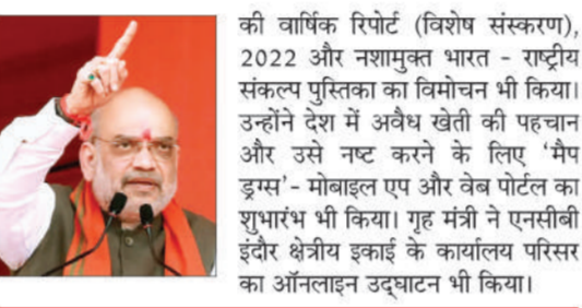
गृह मंत्री अमित शाह ने नशे को आने वाली पीढ़ियों और देश के लिए बड़ी चुनौती बताते हुए कहा है कि सरकार 2047 तक नशामुक्त भारत का निर्माण करने के लिए प्रतिबद्ध है।

नई दिल्ली, (एजेंसी)। केन्द्रीय गृह मंत्री अमित शाह ने नशे को आने वाली पीढ़ियों और देश के लिए बड़ी चुनौती बताते हुए कहा है कि सरकार 2047 तक नशामुक्त भारत का निर्माण करने के लिए प्रतिबद्ध है। श्री शाह ने बुधवार को यहां आयोजित राज्यों और संघशासित प्रदेशों के एंटी-नारकोटिक्स टास्क फोर्स प्रमुखों के प्रथम राष्ट्रीय सम्मेलन को संबोधित करते हुए कहा कि नशामुक्त भारत आने वाली पीढ़ियों और देश के भविष्य के लिए बहुत महत्वपूर्ण है क्योंकि आज हम नशे के खिलाफ लड़ाई में एक ऐसे पड़ाव पर खड़े हैं कि यहां से दृढ़ संकल्प, साहसिक प्रयासों, टीम इंडिया और व्यापक सरकार के अप्रोच के साथ आगे बढ़ेंगे तो हमारी विजय निश्चित है। गृह मंत्री ने इस मौके पर एनसीबी की वार्षिक रिपोर्ट (विशेष संस्करण), 2022 और नशामुक्त भारत - राष्ट्रीय संकल्प पुस्तिका का विमोचन भी किया। उन्होंने देश में अवैध खेती की पहचान और उसे नष्ट करने के लिए 'मैप ड्रम्स' - मोबाइल एप और वेब पोर्टल का शुभारंभ भी किया। गृह मंत्री ने एनसीबी इंडोर क्षेत्रीय इकाई के कार्यालय परिसर का आनंदाशन उद्घाटन भी किया।