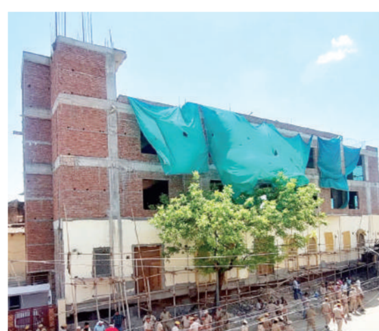
अवैध निर्माण कर बनाया गया होटल जो मुख्यमंत्री अशोक गहलोत के संज्ञान में आते ही धराशायी हो गया।