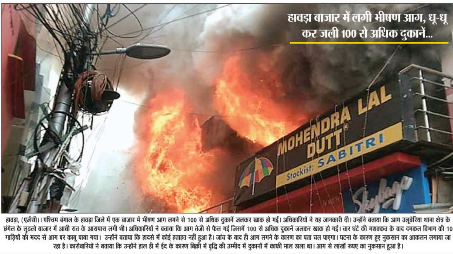
हावड़ा बाजार में लगी भीषण आग, धू-धू कर जली 100 से अधिक दुकानें...