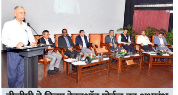
डीजीपी ने किया हेकार्थन पोर्टल का शुभारंभ