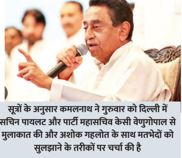
सूत्रों के अनुसार कमलनाथ ने गुरुवार को दिल्ली में सचिन पायलट और पार्टी महासचिव केसी वेणुगोपाल से मुलाकात की और अशोक गहलोत के साथ मतभेदों को सुलझाने के तरीकों पर चर्चा की है

दी गई है। कांग्रेस अध्यक्ष बाहर हैं। कमलनाथ ने कांग्रेस अध्यक्ष तक अपनी बात पहुंचा दी है। इस मामले में बिना गांधी परिवार की सलाह के कोई भी फैसला नहीं लिया जाएगा। सचिन पायलट ने भी दिल्ली जाकर अपनी बात कांग्रेस नेताओं के सामने रख दी है। स्मरण है कि पायलट ने राजस्थान की पिछली भाजपा सरकार के कथित