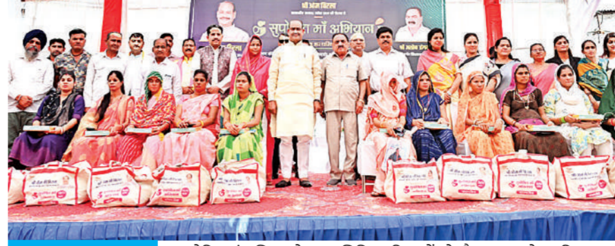
हर माह स्वास्थ्य की भी होगी जांच